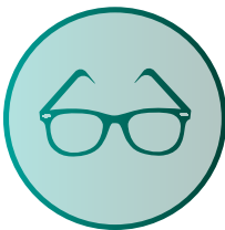
Ferien (mind. 5 Wochen/Jahr)