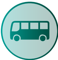
Zugang mit öffentlichen Verkehrsmitteln