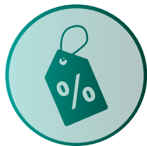
Verschiedene Rabatte gemäss Liste