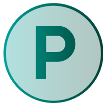
Gratisparkplatz (Auto, Motorrad, Fahrrad)