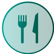
Verpflegung (Möglichkeiten vor Ort)