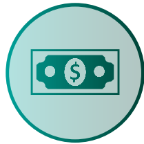
Bonus bei Schichtarbeit (auch auf 13. Monatslohn + bei Abwesenheit)